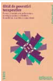
Editura Trei 2022 Preis: 18,00 €

There is a commentary to each story at the end of the book concerning its therapeutic use as well as a key word register and a detailed explanation for the therapist to understand the background and theory behind storytelling, linked to hypnotherapy, systemic therapy and NLP techniques.