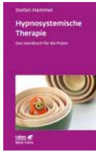
Klett-Cotta 2022 Preis: 35,00 €