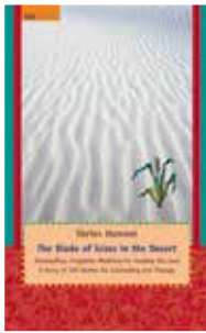
impress 2012 Preis: 17,80 €

With clear guidance on how stories can be applied to encourage positive change in people, groups and organisations, the Handbook of Therapeutic Storytelling is an essential resource for psychotherapists and other professions of health and social care in a range of different settings, as well as coaches, supervisors and management professionals.