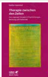
Klett-Cotta 2014 Preis: 35,00 €

Das »Modellieren von Lebensmöglichkeiten« bietet die Chance, mit noch nie aktualisierten oder neu kombinierten Identitäten der eigenen Person Erfahrungen zu sammeln. Der Ansatz hat sich bei einer großen Anzahl an Störungen bewährt, da unwillkommene Symptome so »verabschiedet« werden, dass sie nicht durch die Hintertür wieder hereinkommen müssen.