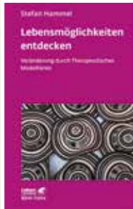
Klett-Cotta 2019 Preis: 32,00 €

Das über 300seitige Grundlagenwerk verdeutlicht, aus welchen Quellen Hypnosystemische Therapie sich speist, welche Prinzipien und Wirkmechanismen der hypnosystemischen Arbeit zugrunde liegen, auf welche Ideen der Entwicklung und Lösung von Problemerkleben zurückgegriffen werden kann und welche Rolle das Verständnis von Rolle und Identität, von Trauma und Konflikten dabei spielt. Ausführlich werden unterschiedliche Interventionsarten gezeigt und mit vielen beispielhaften Einzelinterventionen veranschaulicht. Register zu den einzelnen Interventionen, zu Diagnosen und Problemstellungen sowie wichtigen Personen, Institutionen und Veröffentlichungen im Arbeitsfeld runden das Werk ab.