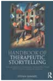
Routledge 2019 Preis: 34,50 €